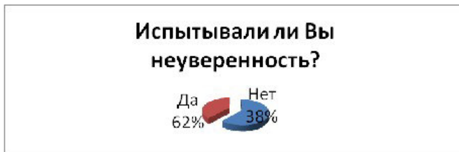
Рисунок 4. Чувства, испытываемые при землетрясении (неуверенность).

На вопрос « Испытывали ли Вы страх во время землетрясения?» утвердительно ответили 17 человек (65 % опрошенных). Не испытывали страх (по разным причинам, в том числе, потому что не успели понять, что происходит) 9 человек, соответственно 35% опрошенных [рис. 3].