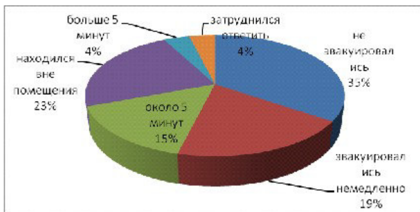
Рис.2 Эвакуация во время землетрясения.

На момент землетрясения 8 человек спали.