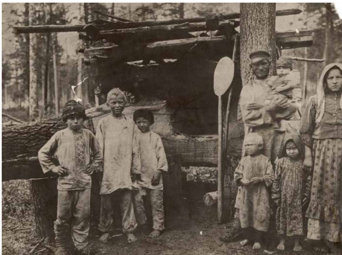
Крестьяне-переселенцы в Сибири.