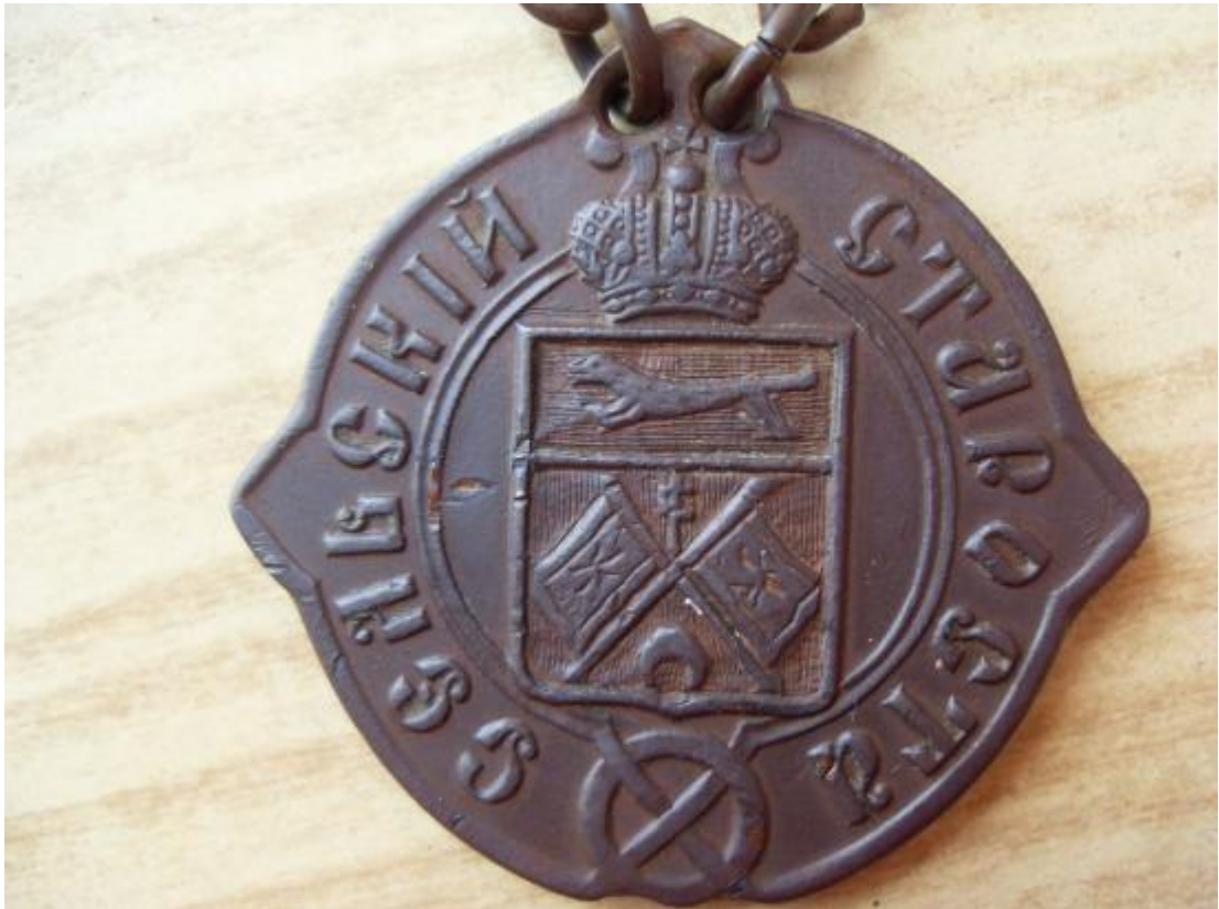
Нагрудный знак сельского старосты.

Сельская полиция. «Сотский у нас получается самой настоящей полицейской властью и прямым помощником урядника по разным дракам, кража, убийствам. Поэтому в сотские выбирают мужиков здоровых и самостоятельных. А в десятские суют самых бедных, самых безответных. Десятский считается в деревне тоже полицейской властью. Но только самой маленькой. Надо старосте созвать сход, и вот десятский ходит, стучит в каждый дом и гонит хозяина на сходку. Надо сопровождать арестованных на отсидку в волостную тюрьму, опять же для этого снаряжают десятского».