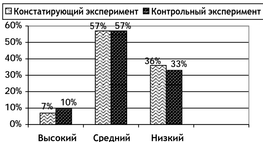
Рис. 3 Гистограмма уровней эстетического развития детей среднего дошкольного возраста по отношению к природе контрольной группы на констатирующем и контрольном этапах (в %)

Для наглядности на основе данных таблицы 3 и таблицы 6 составлены гистограммы (рисунок 3, 4).