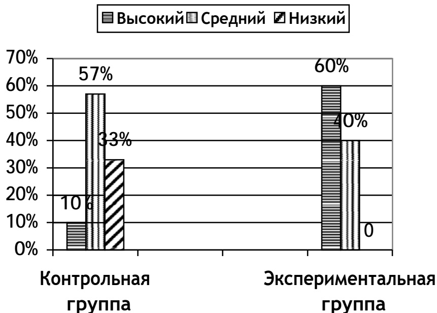
Рис. 2 Гистограмма уровней эстетического развития детей среднего дошкольного возраста по отношению к природе на контрольном этапе (в %)

Это свидетельствует об эффективности комплекса прогулок-наблюдений направленных на эстетическое развитие детей среднего дошкольного возраста в процессе ознакомления с природой.