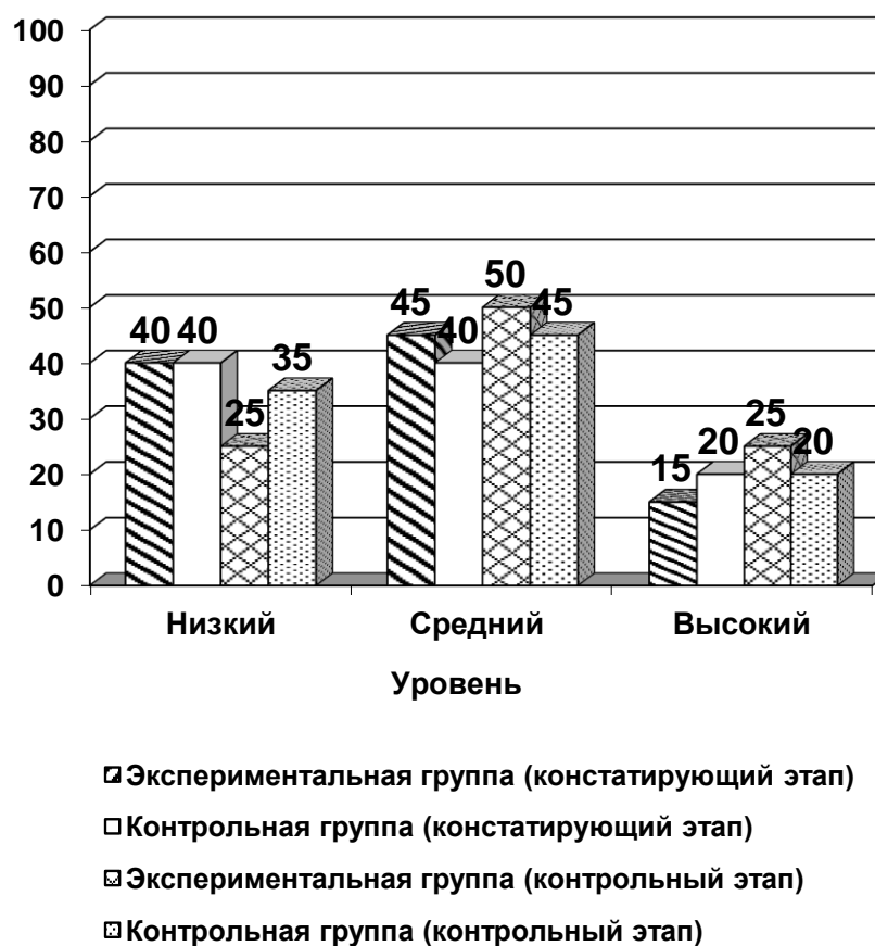
Рис. 3. Гистограмма уровней развития качественного словаря у детей старшего дошкольного возраста в экспериментальной и контрольной группах (на констатирующем и контрольном этапах)

На основе этих результатов построена гистограмма на рисунке 3.