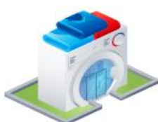
Магазины бытовой техники