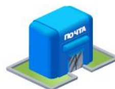
Отделения почтовой связи

Всю дополнительную необходимую информацию о телевизионном вещании в Алтайском крае Вы также можете получить по телефонам: 8 (3852) 50-64-98 – центр консультационной поддержки Алтайского филиала РТРС