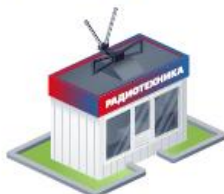
Магазины на рынке радиотехники